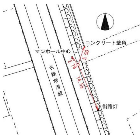
要図 縮尺: 1/500