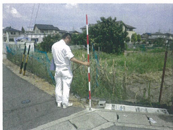
地 上 写 真